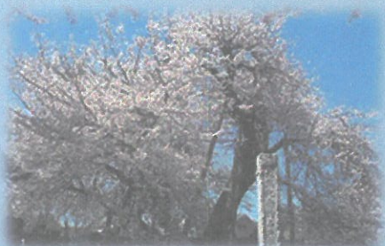
石戸蒲ざくら（日本五大桜）